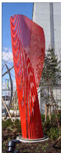
東玄関 南・モニュメント 「It Blows」 風が吹いてきたよ 齊藤 均 / Hitoshi SAITO