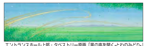
エントランスホール上部・タペストリー原画「風の声を聞く-とわのみどり-」